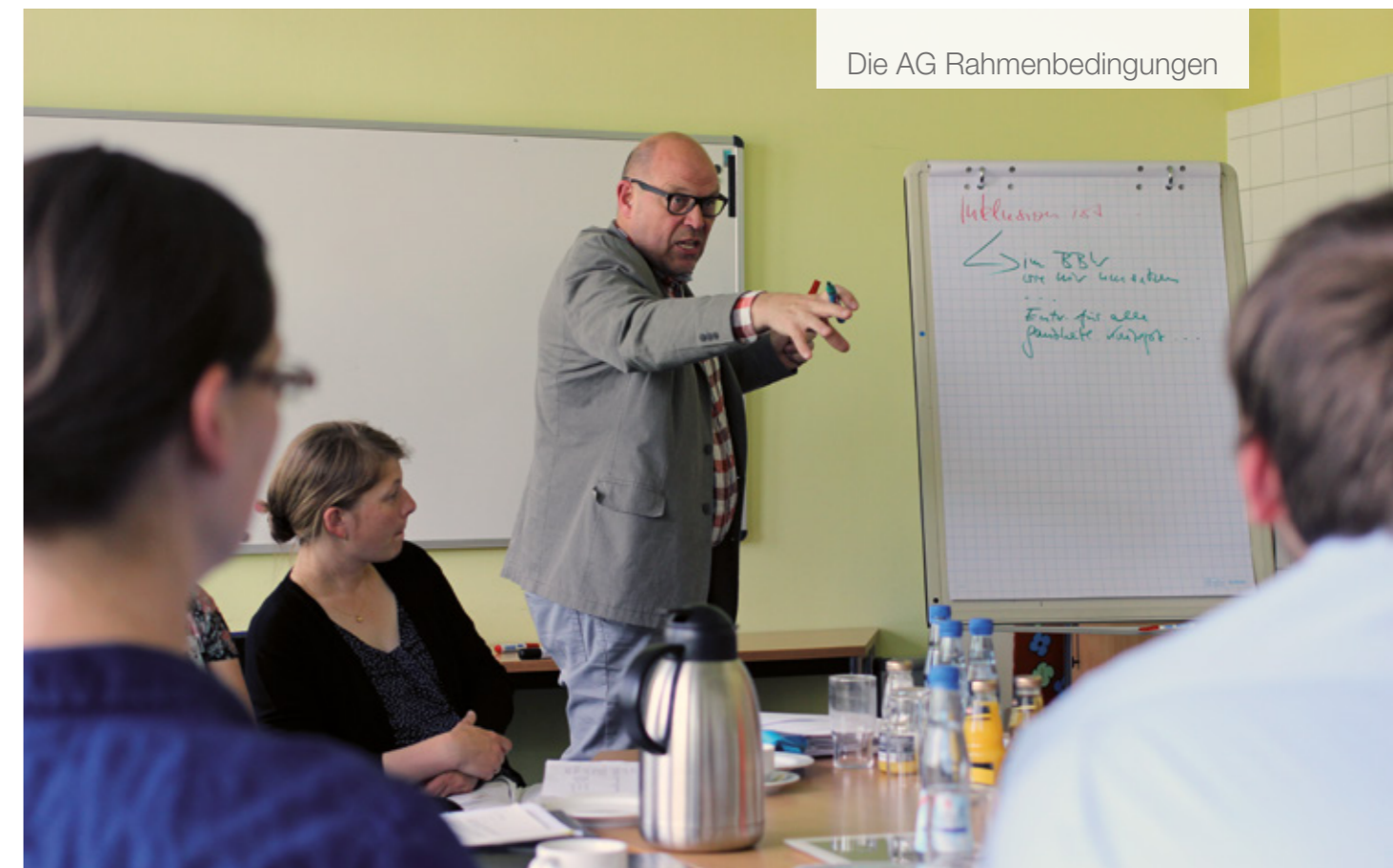
Die AG Rahmenbedingungen

Die UN-BRK verlangt „... die Förderung einer respektvollen Einstellung gegenüber den Rechten von Menschen mit Behinderungen auf allen Ebenen des Bildungssystems ...“ UN-BRK, Artikel 8 (2) b)