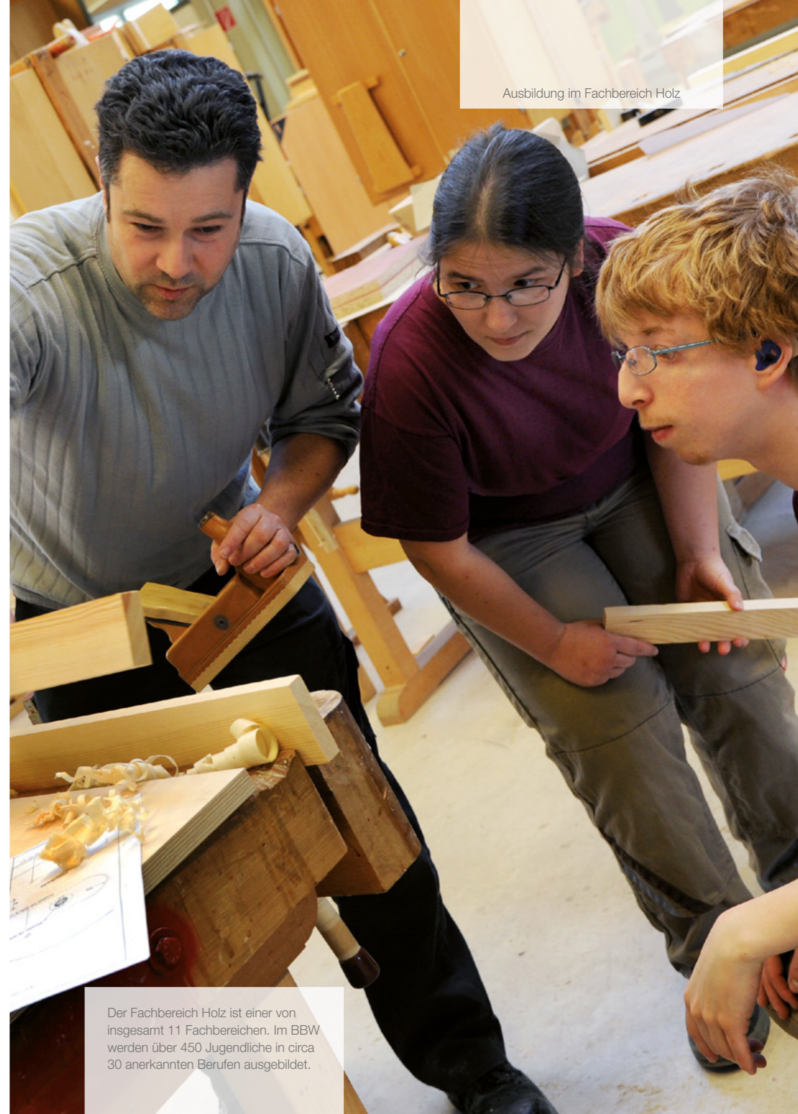
Ausbildung im Fachbereich Holz

Der Fachbereich Holz ist einer von insgesamt 11 Fachbereichen. Im BBW werden über 450 Jugendliche in circa 30 anerkannten Berufen ausgebildet.