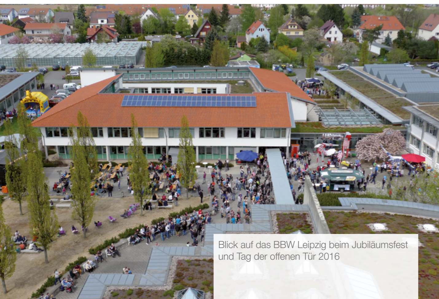
Blick auf das BBW Leipzig beim Jubiläumsfest und Tag der offenen Tür 2016

Besonders wichtig sind für das BBW Leipzig: Information und Kommunikation, Beteiligung und die entsprechenden Rahmenbedingungen. Der BBW-Aktionsplan soll aber nicht nur innerhalb des BBW wirken, sondern soll über das BBW hinaus Impulse in die Gesellschaft senden.