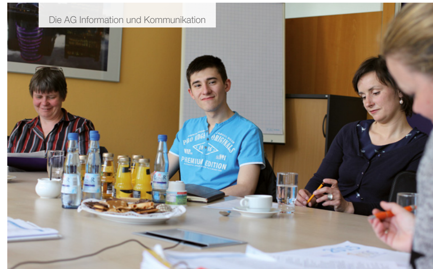
Die AG Information und Kommunikation

„... wie wichtig es ist, dass Menschen mit Behinderungen vollen Zugang zur physischen, sozialen, wirtschaftlichen und kulturellen Umwelt, zu Gesundheit und Bildung sowie zu Information und Kommunikation haben ...“ UN-BRK, Präambel v)