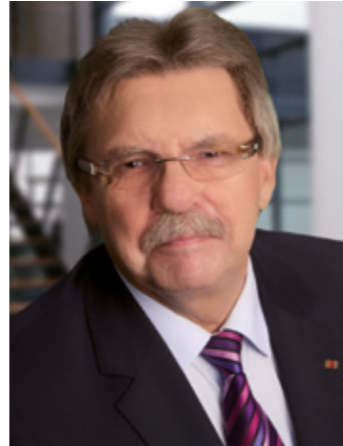
Stephan Pöhler Beauftragter der Sächsischen Staatsregierung für die Belange von Menschen mit Behinderungen